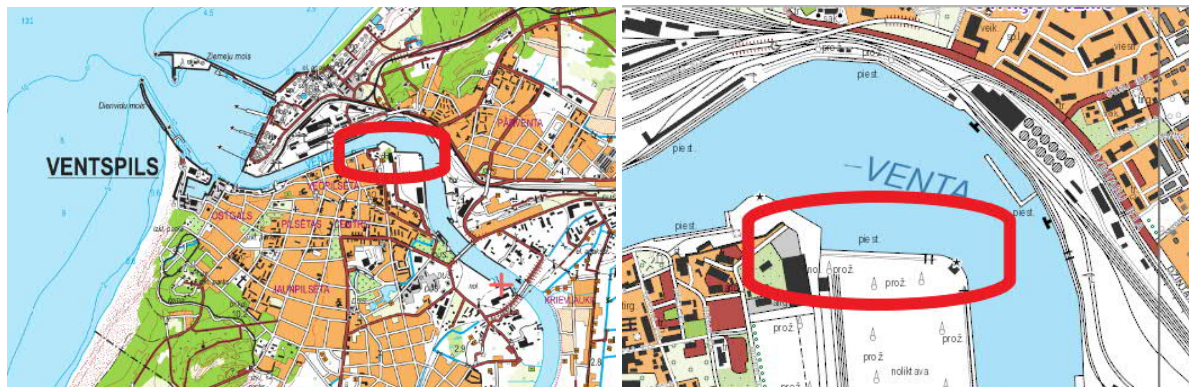
Attēls Nr.1. Objekta atrašanās vieta.

Būvobjekts atrodas Ventspils brīvdabas teritorijā, uz Zemes gabala ar kadastra nr. 27000041516. Zemes gabala īpašnieki – Ventspils valstspilsētas pašvaldība. Būvdarbi tiks veikti piestātnes Nr.16 teritorijā, kur tiks veikta kuģu tauvošanās aprīkojuma atjaunošana – 150t vētras poleru izbūve.